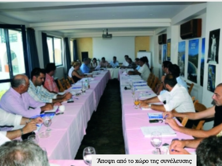
Άποψη από το χώρο της συνέλευσης