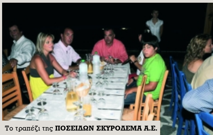
Το τραπέζι της ΠΟΣΕΙΔΩΝ ΣΚΥΡΟΔΕΜΑ Α.Ε.